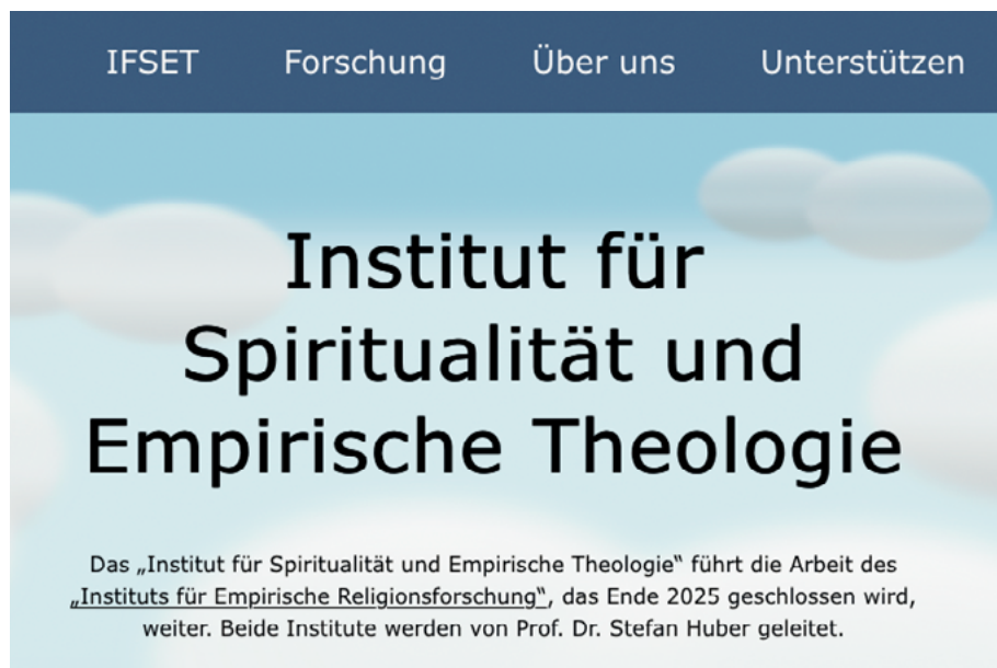
Startbildschirm des Instituts für Spiritualität und Empirische Theologie ( ifset.ch )

Inzwischen durfte ich an der STH Basel bereits zwei Seminare durchführen und an verschiedenen Anlässen teilnehmen. Das hat mich begeistert! Ich lernte einen Diskurs-Raum kennen, in dem frei geforscht, gedacht und diskutiert wird. Auch unbequeme Fragen können gestellt werden. Zugleich muss man sich an diesem Ort nicht dafür schämen, wenn man den Messias Jesus liebt und ihm mit ganzem Herzen nachfolgen will. Es fühlt sich für mich an, wie wenn ich nach vielen Umwegen endlich nach Hause gekommen bin. ■