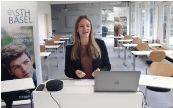
Erste Begegnung – digital, aber persönlich

Im Oktober 2025 und Februar 2026 öffneten die Online-Kennenlern-Webinare eine niederschwellige Tür. Von zuhause aus erhielten Interessierte Einblick in Studiengänge, Inhalte und Perspektiven. Lehrende stellten das Profil der Hochschule vor, Studierende berichteten vom Alltag.