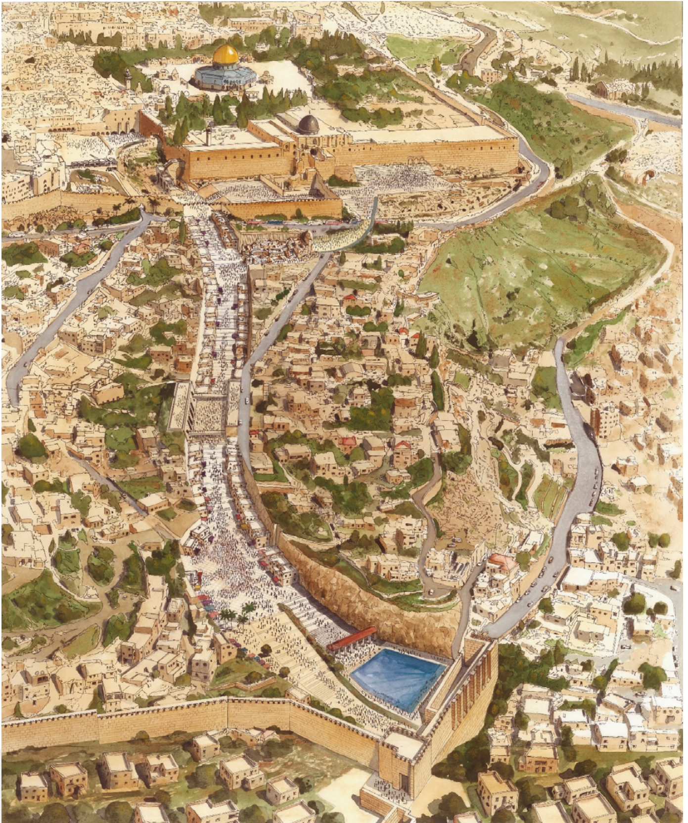
Künstlerische Darstellung des Pilgerwegs während der 2000 Jahre alten zweiten Tempelperiode. Der heutige Weg ist grösstenteils unterirdisch.

Joh 9 ist eines von vielen Beispielen, wie im Johannesevangelium historisch-archäologische und geistliche Aspekte miteinander verbunden werden. Besonders im deutschsprachigen Raum neigt man in der christlichen Theologie immer wieder