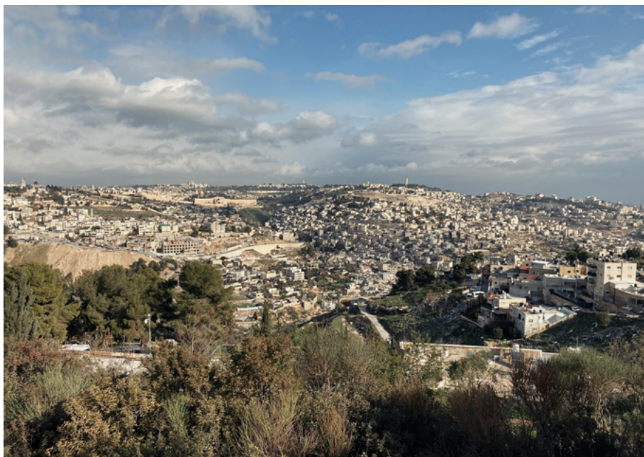
Friedenswald mit Ausblick zum Norden – Ölberg, Kidrontal, Tempelberg

Ich vermute, dass Kithairos mit Kathros identisch ist. Die Familie (bzw. das «Haus») des Kathros wird in bPes 57a (Babylonischer Talmud) nach der Familie des Hannas genannt. Aufgrund einer