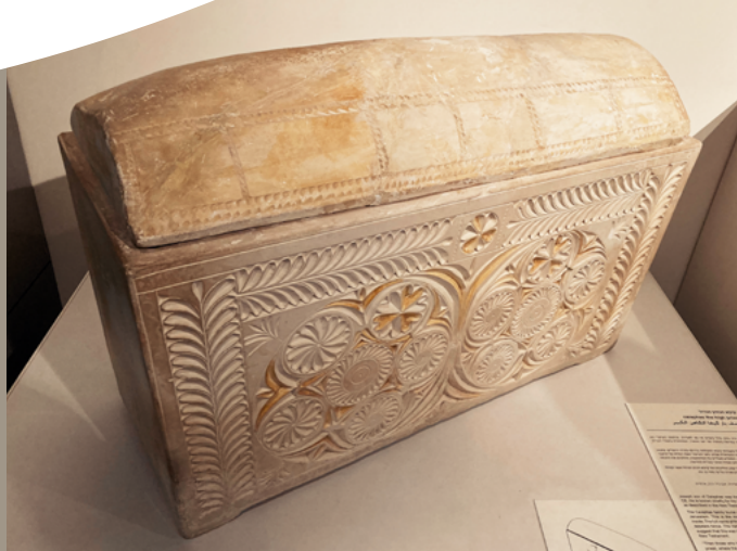
Ossuar von Joseph bar Kaiapha im Israel-Museum von Jerusalem